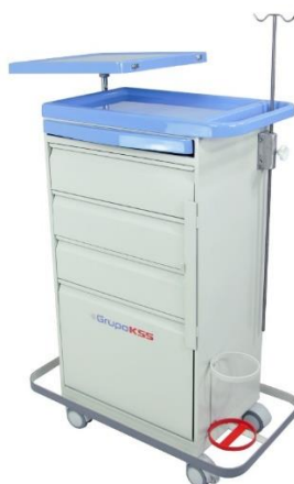
MOD.: CARRO DE EMERGÊNCIA COMPACTO REG.; M.S. nº. 10242640037

Indicado p/ uso no ambiente hospitalar podendo ser utilizado tanto como Carro de Administração de Medicamentos, como também um Carro de Emergência. É dotado de 04 gavetas com guias deslizantes (03 delas na altura de 13 cms e um gavetão na altura de 36 cms), sendo 02 delas com colméias com 11 divisórias cada (totalizando 22 divisórias), possui dispositivo de trava gavetas com lacre, com fechamento total de todas as gavetas, tampo superior em fiberglass dividido em duas partes, sendo tampo principal e bandeja auxiliar para manipulação de medicamentos. Possui prateleira giratória (360°) para monitor regulável em altura medindo 40x40 cms, extensão elétrica de 03 metros com 04 tomadas com 02P + T. Móvel confeccionado em chapa de aço com pintura eletrostática a pó. Possui rodízios de 4" (com giro de 360°) com sistema de travas (freios) nas diagonais para sua maior segurança. Acessórios: tabua de massagem cardíaca, para-choque de proteção lateral, suporte para cilindro O2 e suporte de soro com altura regulável. Dimensões: Larg: 505 mm x Prof: 360 mm x Alt: 960 mm. Dimensões uteis do tampo: Larg.: 440 x Prof.: 290 mm. Gavetas: Larg. 410 x Prof: 28 mm. Grau de proteção IPX4.